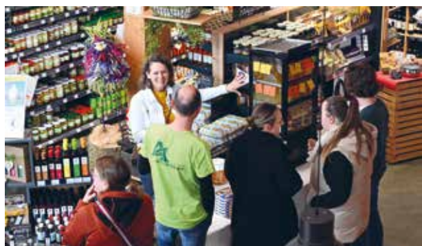
Bei den Ausstellenden im Bio-Frischmarkt wurden gesunde Produkte verkostet.