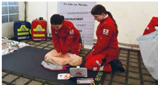
Rotes Kreuz beim Gesundheitstag.