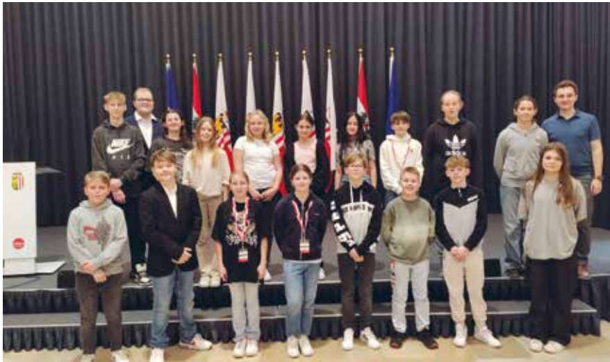
Das Schülerparlament der TNMS Eferding Nord im OÖ Landtag.