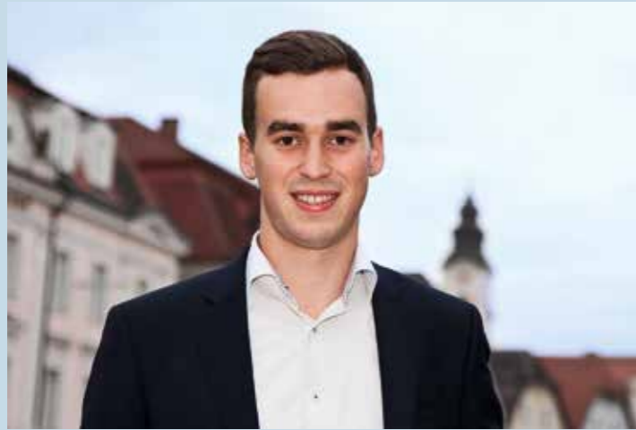
Bürgermeister Severin Mair