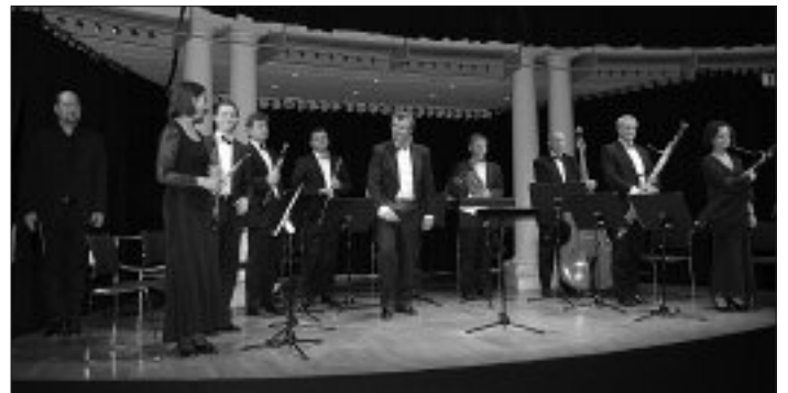
Das Harmonieorchester der Musikschule Eferding bei seinem Konzert in Passau.

Die gelungene Vernissage brachte den kunstinteressierten Besuchern und den Künstlern beider Vereine einen gemütlichen, unterhaltsamen Abend.