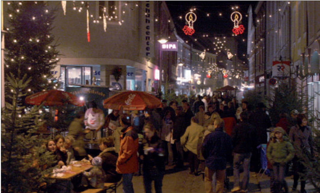
Der Schmiedstraßen-Adventzauber ist jedes Jahr ein schönes Erlebnis und der Auftakt für die Advent- und Weihnachtszeit in Eferding.

Zugestellt durch Post.at • An einen Haushalt • Postentgelt bar bezahlt