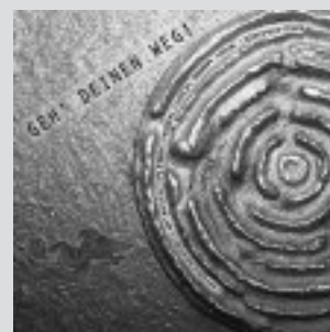
CD „Geh' Deinen Weg“

PS: Wer diesem Lied folgt, kann sehr glücklich werden – ein Song für Kinder bis 99 1/2.