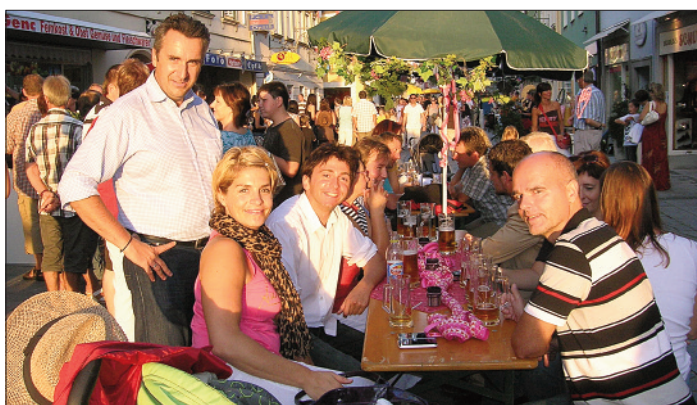
Eferdinger Woche: Weinfest in der Schmiedstraße (oben) und Oldtimertreffen (rechts).

7. September hieß es zeitig in der Früh in Eferding sein, trafen sich doch Oldtimer aus ganz Österreich zu einer Ausfahrt ins Eferdinger Landl am Stadtplatz. Ein besonders stimmungsvolles Bild bot sich den zahlreichen Besuchern des Flohmarktes am Schiferplatz als die liebevoll restaurierten Gefährte aus längst vergangenen Zeiten vorbeifuhren. Auch die restlichen Veranstaltungen der Eferdinger Woche waren zum Großteil gut besucht, was auf eine Wiederholung im nächsten Jahr hoffen lässt.