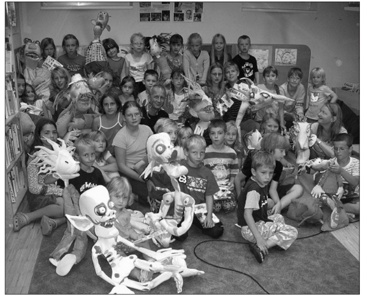
Ferienkalender-Aktion: Volles Haus bei der 5. Lesenacht in der Eferdinger Stadtbücherei.

September fasziniert von seinen lebensgroßen selbstgeschneiderten Figuren, die er mit viel Humor und Coolness zum Leben erweckte. Bei den Schwarzlichtepisoden wurde es so manchen ganz schön gruselig. Eine der Kostproben war aus seinem Buch „Verknallt im All“ - daher gab es zum Schluss noch ein Planetenbuffet, das rasch und begeistert geleert wurde. Die Stadtbücherei Eferding ist jeden Mittwoch von 15 bis 19 Uhr und Freitag von 14 bis 18 Uhr geöffnet.