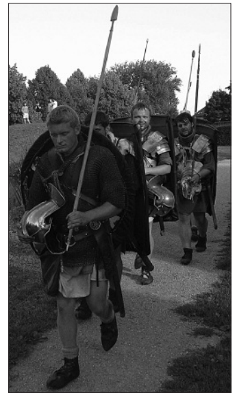
Einzug der Legionäre beim Eferdinger Ententeich im Mittergraben.

ben bis zum Jahresende abgeschlossen werden.