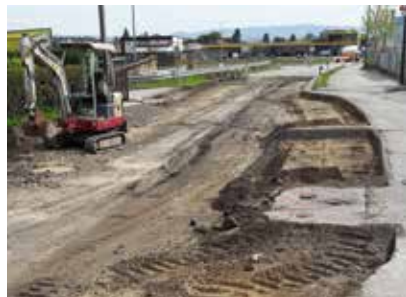
Abfräsen des alten Belages