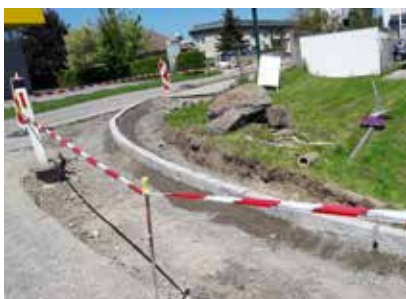
verlegen der Leistensteine