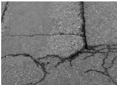
Schäden Karl Schachingerstraße