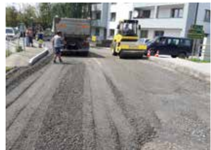
Herstellen vom neuem Unterbau