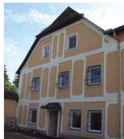
Haus des ehemaligen Margaretenbenefiziums, heute Kindergarten

Gebäude des Kindergartens (Schiferplatz 5) fassbar ist. Zudem könnten unter der Oberfläche des im frühen 18. Jahrhundert angelegten Schiferplatzes Überreste des vor 1708 abgerissenen ehemaligen Magdalenenbenefizienhauses zu finden sein. Gemeinsam mit den Kapellen und Grabdenkmälern in und an den Eferdinger Kirchen wird durch die ehemaligen Benefizienhäuser das blühende mittelalterliche Stiftungswesen in Eferding ein Stück weit in die Gegenwart geholt und dessen Bedeutung unterstrichen, zumal es nur sehr selten der Fall war, dass jedem zugestifteten Kaplan ein eigenes Wohnhaus für sich allein zukam.