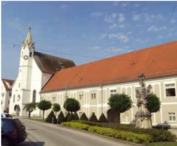
Die Eferdinger Spitalskirche mit dem Schiferschen Erbstift

Auf einen Teil seines materiellen Vermögens zu verzichten, um dafür eine geistliche Gegenleistung zu erhalten und sich dadurch einen Platz im Himmel zu sichern, erfreute sich im Mittelalter großer Beliebtheit. Ein Paradebeispiel florierender mittelalterlicher Stiftungstätigkeit war die Stadt Eferding, wo bei einem Stadtspaziergang nach wie vor zahlreiche Zeugnisse dieses Bereichs der Geschichte begegnen: