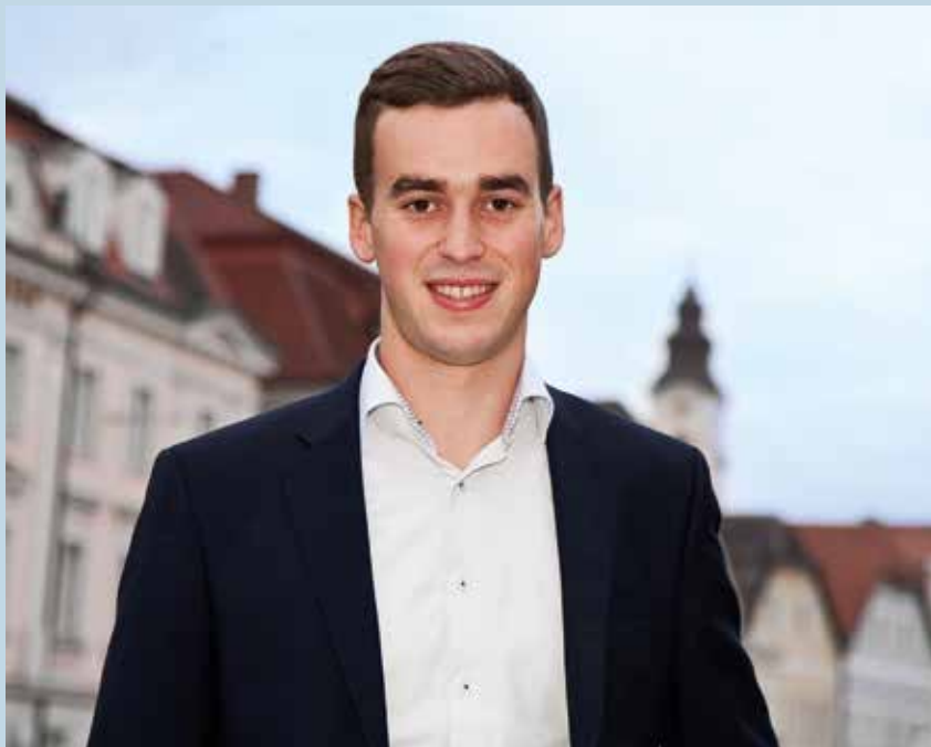
Bürgermeister Severin Mair